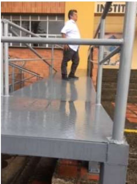
INVITACION HERRAMIENTA TALLERES